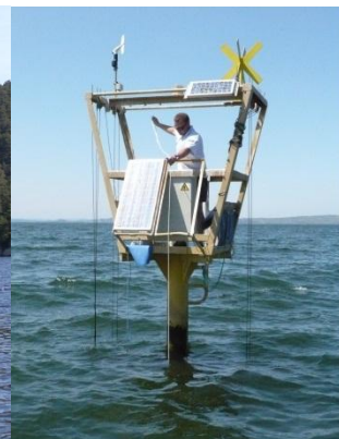
Recherche et développement sur l'Étang de Berre