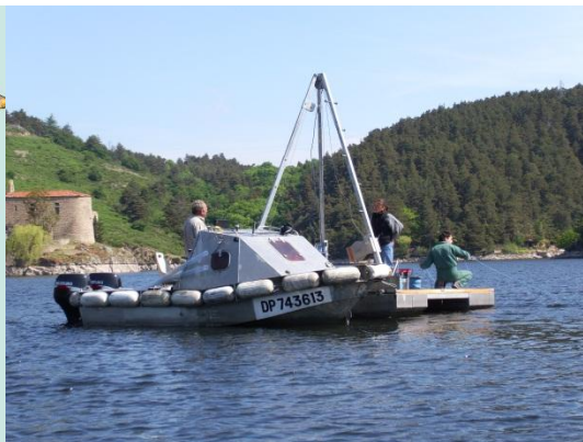
Opération de carottages